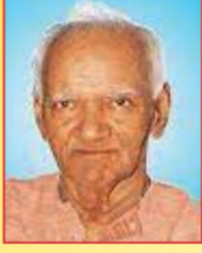
वैदमूर्ति तपोनिष्ठ पंडित श्रीराम शर्मा आचार्य

ॐ भूर्भुवः स्वः तत्सवितुर्वरेण्यं भर्गो देवस्य धीमही धियो यो नः प्रचोदयात् ।।