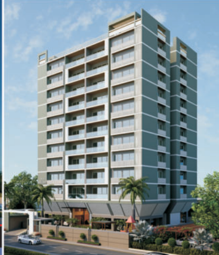
OPP. CA BHAWAN, SECTOR 14