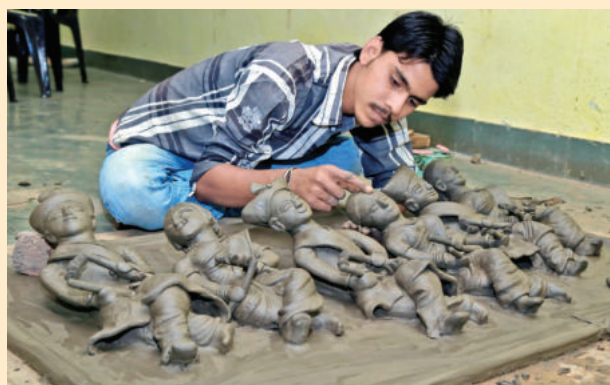
विश्व प्रसिद्ध मोलेला गांव के शिल्पकार माटी की कलाकृति को उभारते हुए।