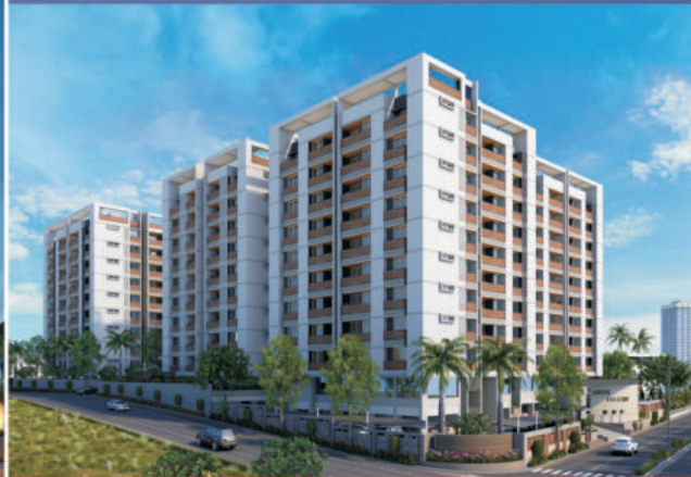
100 FT. ROAD, SOBHAGPURA