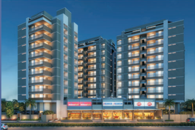
NEW VIDHYA NAGAR, SECTOR - 3