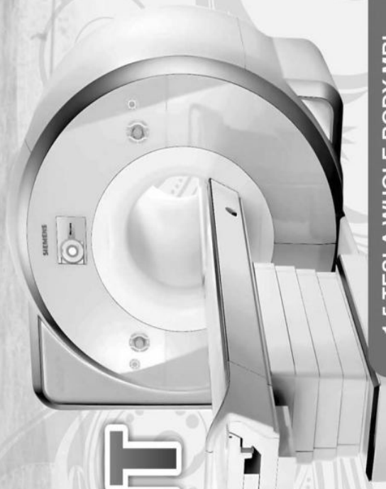
1.5 TESLA WHOLE BODY MRI