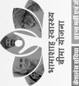
भामाशाह स्वास्थ्य बीमा योजना

शुरूआती जांच कीमत* CT SCAN ₹ 1250 शुरूआती जांच कीमत* M.R.I. ₹ 2500 CT Coronary Angiography ₹ 5000