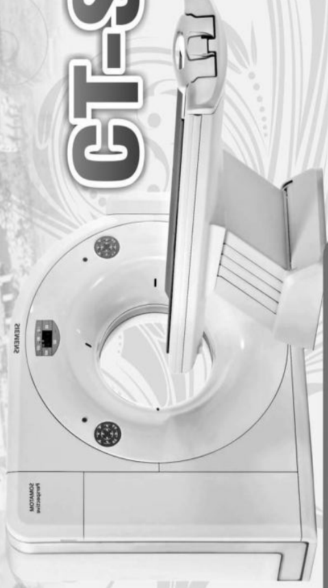
128 SLICE CARDIAC CT SCANNER