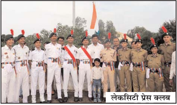
लेकसिटी प्रेस क्लब

सभी को स्वाधीनता दिवस की शुभकामनाएं दीं। मंत्री ने मेवाड़ की भूमि को प्रणाम करते हुए आजादी के लिए बलिदान देने वाले वीर-वीरांगनाओं को नमन किया। इस अवसर पर जिले में विशिष्ट कार्य करने एवं उल्लेखनीय सेवा प्रदान करने वाले 71 व्यक्तियों व संस्थाओं को प्रशस्तिपत्र देकर सम्मानित किया। मुख्य