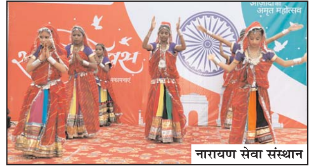
नारायण सेवा संस्थान

नारायण सेवा संस्थान के सभी परिसरों में स्वतंत्रता दिवस देशभक्तिपरक कार्यक्रमों के साथ मनाया गया। मानव मंदिर में