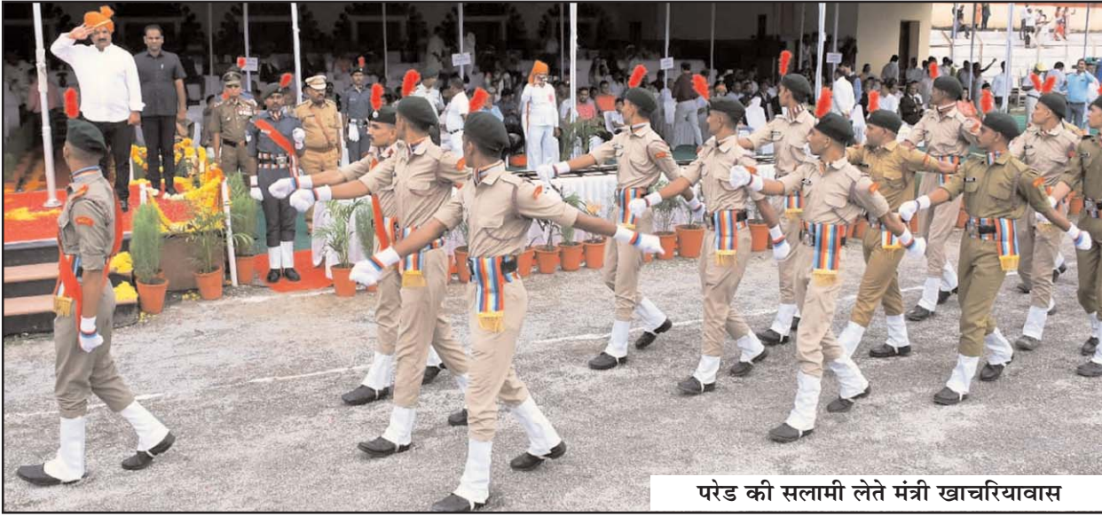
परेड की सलामी लेते मंत्री खाचरियावास

उदयपुर (ह. सं.)। स्वतंत्रता दिवस 2022 का जिला स्तरीय समारोह गांधी ग्राउंड में धूमधाम व हर्षोल्लास के साथ मनाया गया। इस अवसर पर खाद्य एवं नागरिक आपूर्ति और उपभोक्ता मामले मंत्री प्रतापसिंह खाचरियावास ने राष्ट्रीय ध्वज फहराया और